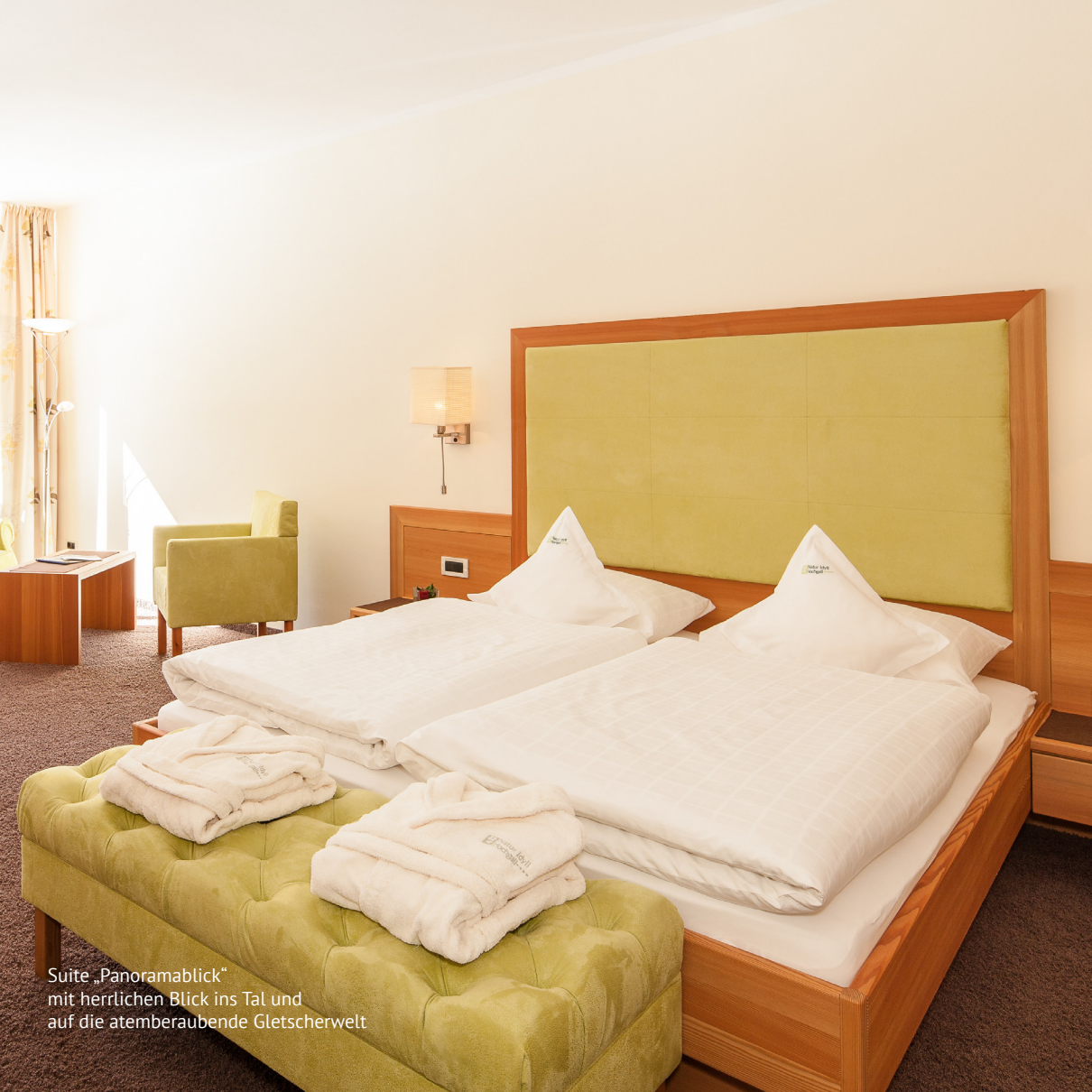
Suite „Panoramablick“ mit herrlichen Blick ins Tal und auf die atemberaubende Gletscherwelt