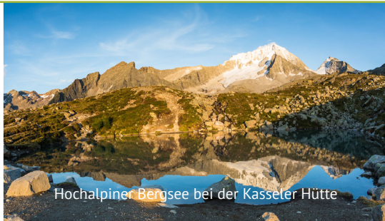
Hochalpiner Bergsee bei der Kasseler Hütte