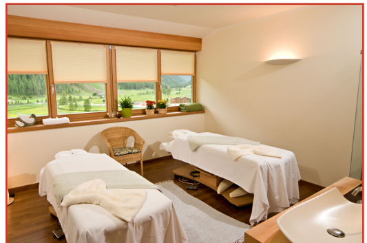
25m 2 große Panorama Behandlungsräume

Deshalb kann man sich im Hause aufhalten wo immer man will, man ist ungestört und Entspannung und Erholung im Auszeit-Hotel Natur Idyll Hochgall wird gewährleistet.