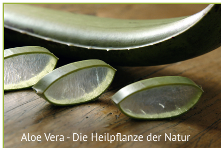
Aloe Vera - Die Heilpflanze der Natur

Wir Menschen sehen es häufig als selbstverständlich an, dass unser Körper funktioniert. Und nicht selten vernachlässigen wir den „Tempel“ unserer Seele. Im Natur Idyll Hochgall werden Sie auf ganz unterschiedlichen Wegen behutsam und achtsam zum eigenen Körper herangeführt. Mit Fitness- und Entspannungsübungen, Aloe Vera Behandlungen und unserer einzigartigen Green Luxury Wirkstoff-Kosmetik „Pharmos Natur“ wird die eigene Weisheit des Körpers spürbar und die Brücke zur Seele „gebaut“.