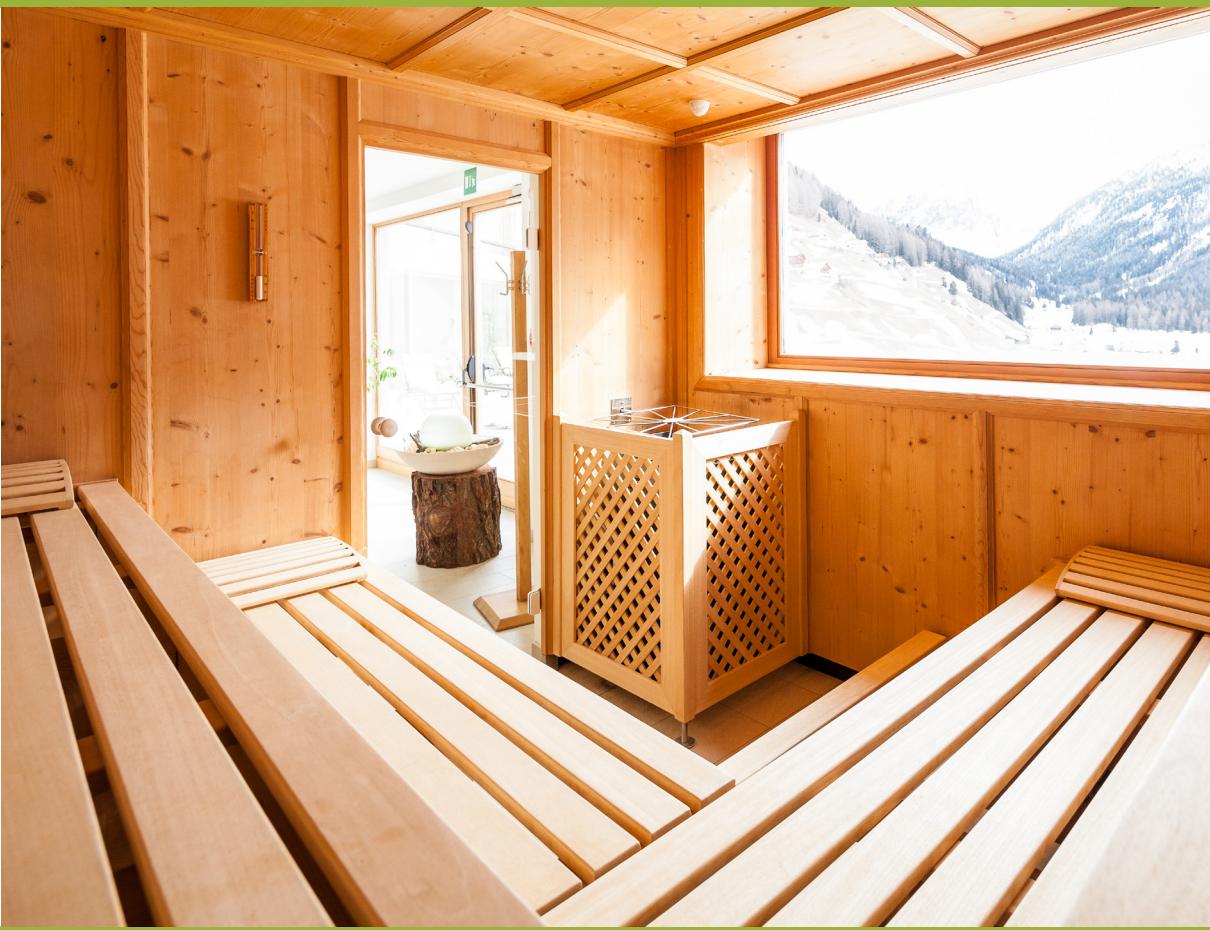
Einzigartige Panoramasauna mit wunderschönen Ausblick auf die Gletscherwelt im Naturpark Rieserferner