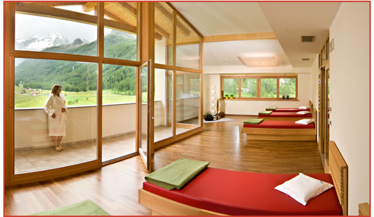
3 Panorama-Ruheräume im Auszeit-Hotel